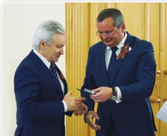
Депутат Государственной думы Александр Клыканов отмечен Почетным знаком Думы Астраханской области за развитие парламентаризма

В этом году принят проект обращения к Государственной Думе и Совету Федерации по вопросу внесения изменений в федеральное законодательство в части администрирования налога на имущество физических лиц, налоговая база которого исчисляется исходя из кадастровой стоимости. Астраханские парламентарии считают, что необходимо исключить из закона «Об оценочной деятельности» 5-летний срок на оспаривание результатов массовой кадастровой оценки через комиссию при Росреестре. Это связано с тем, что закон был принят в 2012 году, и соответственно – 5 лет, отведенные на пе-