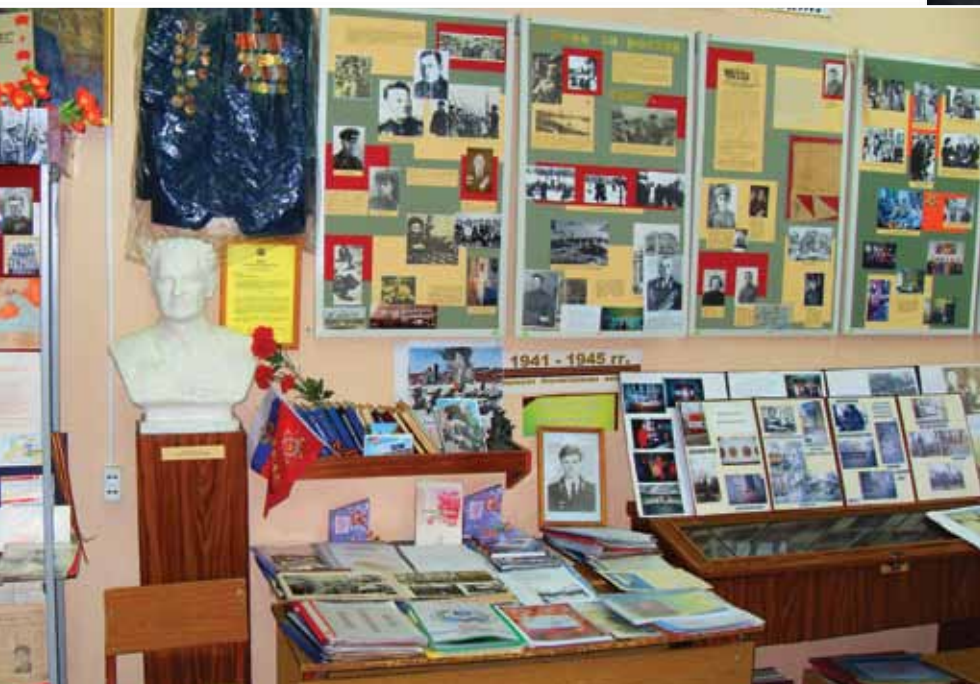
Музей школы № 8 им. Рашутина Г.Д. в г. Ростове-на-Дону.

поступки во время освобождения Ростова от фашистско-немецких захватчиков, трогают нас до глубины души, невольно задаешься вопросом, смогло бы нынешнее молодое поколение пережить всё, что довелось выстрадать детям войны.