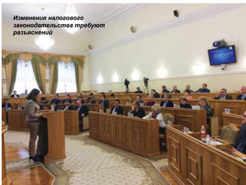
Изменения налогового законодательства требуют разъяснений

Также постоянно проводится работа по инвентаризации бюджетных полномочий и по другим направлениям, волнующим органы местного самоуправления, ведь они – одни из основных исполнителей многих государственных программ.