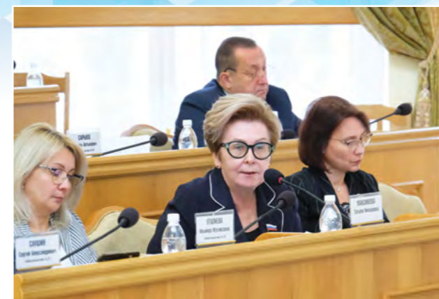
В АДРЕС ФЕДЕРАЛЬНЫХ ОРГАНОВ ВЛАСТИ ДУМОЙ В 2018 ГОДУ БЫЛО НАПРАВЛЕНО 12 ОБРАЩЕНИЙ. С НАЧАЛА 2019 – 4. МНОГИЕ ИНИЦИАТИВЫ ПОДДЕРЖАНЫ.

Началась работа по пересмотру методики расчета потребительской корзины. Депутаты Думы Астраханской области убеждены, что необходимо приблизить состав корзины к современным потребностям людей. Итоги прогнозировать пока сложно, но работа началась. Главное – изменить саму методику, соотношение внутри продуктового набора и процентное соотношение стоимости продовольственных и непродовольственных товаров, а также услуг. В Думу пришло подтверждение, что создана рабочая группа, которой предстоит усовершенствовать методику расчета потребительской корзины и разработать предложения по улучшению качества минимального набора продуктов питания за счет увеличения объемов мяса, рыбы, молока, яиц, овощей, фруктов.