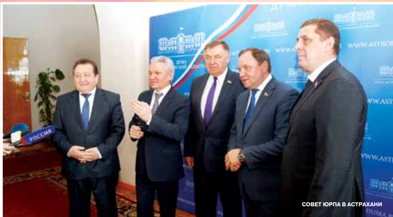
СОВЕТ ЮРПА В АСТРАХАНИ

Весна для Думы Астраханской области выдалась богатой на визиты делегаций парламентов регионов. В ходе встреч обсуждались многие актуальные вопросы, приняты решения о совместном продвижении законодательных инициатив, подписаны соглашения о межпарламентском взаимодействии.