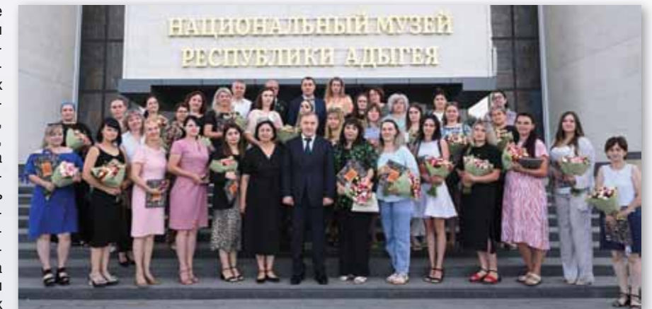
Глава РА М.К. Кумпилов с участниками проекта «ЖЁНЫ ГЕРОЕВ»

Наш земляк погиб при защите села Дьякова Луганской области 8 ноября 1941 года. Оставшись один на один с наступающими фашистами, прикрывая отходящих товарищей, он подорвал себя и фашистов связкой противотанковых гранат со словами «Русские не сдаются». Они стали не только крылатой фразой, олицетворяющей единство многонационального народа России, но и призывом для земляков – участников СВО, которые сегодня в составе артиллерийского дивизиона, носящего имя Героя Советского Союза Хусена Андрухаева, с честью выполняют поставленные боевые задачи, освобождают землю Донбасса от нацистов, как 80 лет назад это делал Хусен Андрухаев. 9 мая 2023 года, находясь вблизи села Дьяково, наши бойцы из