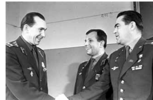
ЮРИЙ ГАГАРИН И АНДРИЯН НИКОЛАЕВ ПОЗДРАВЛЯЮТ АЛЕКСЕЯ ЛЕОНОВА С УСПЕШНЫМ ЗАВЕРШЕНИЕМ ПОЛЕТА

Была рассчитана примерная точка приземления – 150 км от Соликамска. В итоге, посадка произошла в 70 км от Соликамская и в 180 км от Перми в глухой тайге. Павел Беляев практически вслепую вывел "Восход-2" на нужную траекторию. Корабль успешно приземлился