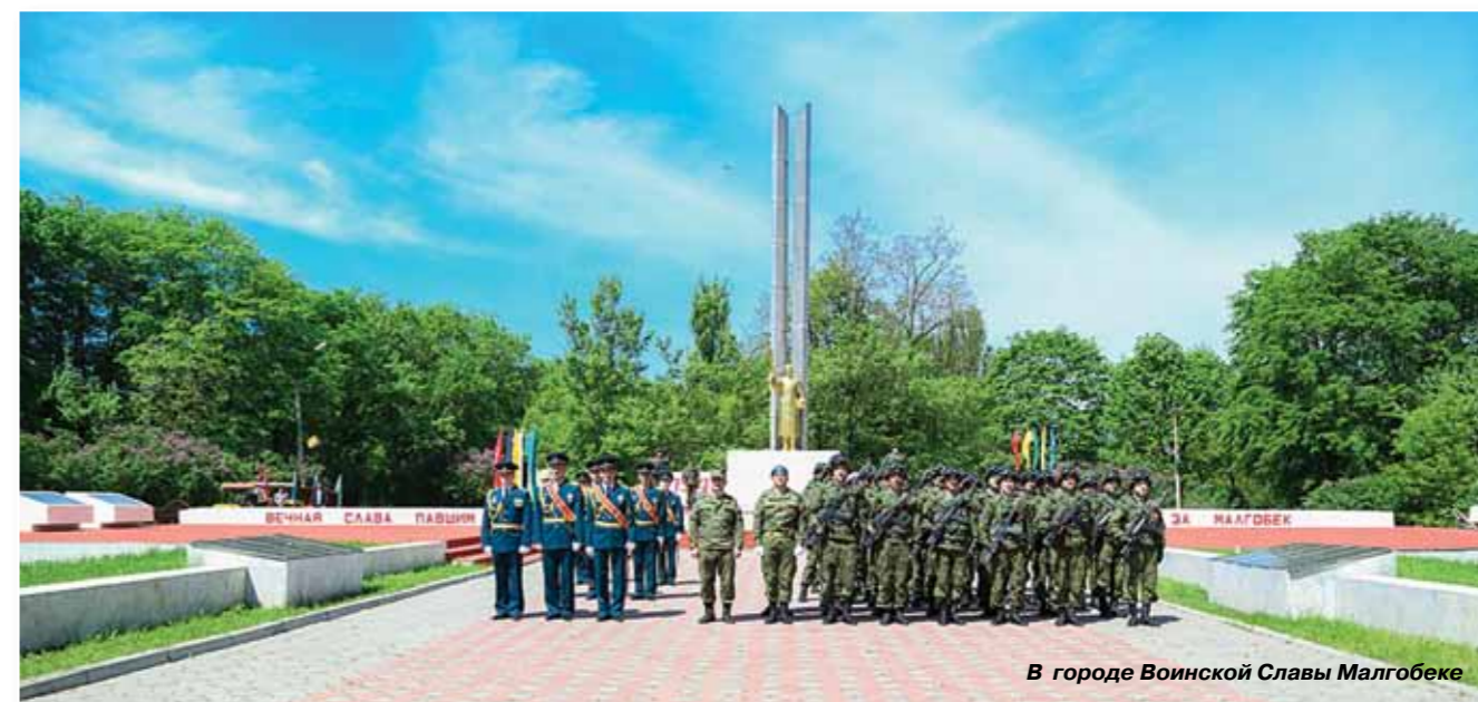
В городе Воинской Славы Малгобеке