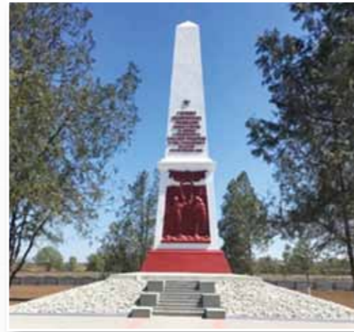
Восстановленный памятный знак «Братская могила красногвардейцев и советских воинов» в селе Ишунь Красноперекопского района.

«Эти люди передали нам код народа-Победителя, и их истории жизни придают силы нам, молодым, дают примеры патриотизма и самопожертвования. Их рассказы помогают облепить сухие параграфы учебников в конкретные имена и события, в медали и ордена, в металл оружия и грубую ткань шинелей, в Подвиг народа», – подчеркнул Владимир Константинов.