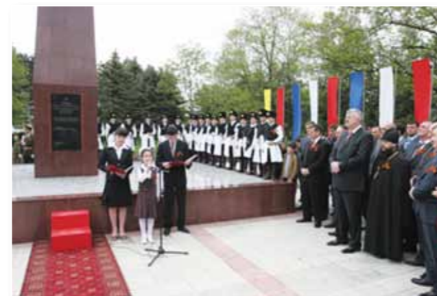
Малгобек – город Воинской Славы

законодательных актов. Обратную связь мы получаем на встречах с избирателями, включая и приемы в Региональной общественной приемной Председателя ВПП «Единая Россия».