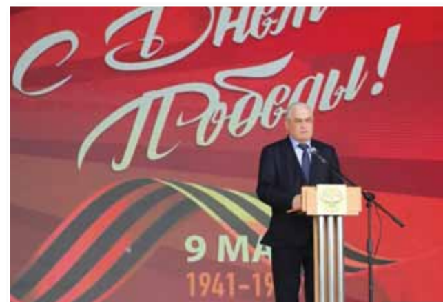
Председатель Народного Собрания Республики Ингушетия Тумгоев М.У.

9 МАЯ - ОДИН ИЗ ВСЕНАРОДНЫХ ПРАЗДНИКОВ, ВЫСТРАДАННЫЙ СТРАНОЙ, ВСЕМ НАРОДОМ В ТЯЖЕЛЕЙШЕЙ ВОЙНЕ, РАВНОЙ КОТОРОЙ НЕ ЗНАЛА ИСТОРИЯ. ОН ВСЕГДА БУДЕТ НАПОМИНАТЬ НАМ, КАКОЙ ЦЕНОЙ ЗАВОЕВАН МИР НА НАШЕЙ ЗЕМЛЕ, ЧТО ДОВОЛОСЬ ПЕРЕЖИТЬ ЛЮДЯМ В ТО СУРОВОЕ ВРЕМЯ.