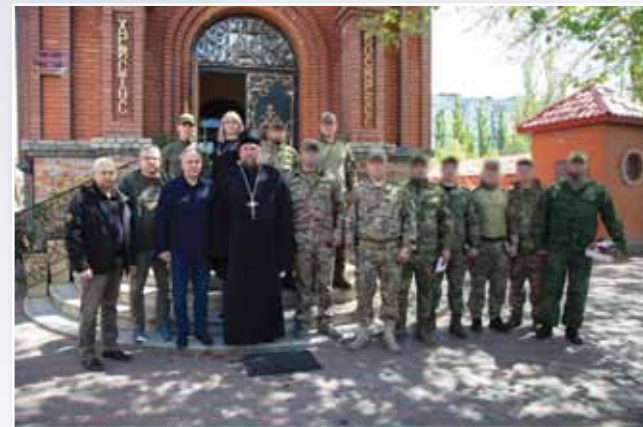
Г. Мелитополь. Запорожская область

По поручению Председателя Госсовета Республики Крым Владимира Константинова Комитет по здравоохранению проводит работу по привлечению частных медицинских организаций для разработки программы лояльности для участников СВО и членов их семей. Подписано трёхстороннее соглашение между 13 частными медицинскими организациями, филиалом Государственного фонда поддержки участников специальной военной операции «Защитники Отечества» по Республике Крым и Межрегиональным общественным движением социальных гражданских инициатив «Команда возможностей» о поддержке участников СВО и членов их семей, включая детей погибших участников СВО. В соответствии с условиями соглашений для данной категории граждан предусматриваются скидки на услуги, предоставляемые медицинскими учреждениями.