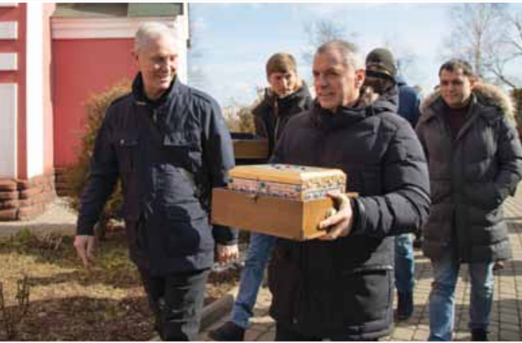
Частицу мощей Святого великомученика Георгия Победоносца передал Храму Всех Святых в земле Крымской просиявших В. Константинов

го образца, утвержденного Правительством РФ, которая подтверждает участие в спецоперации. Документ можно получить на Госуслугах.