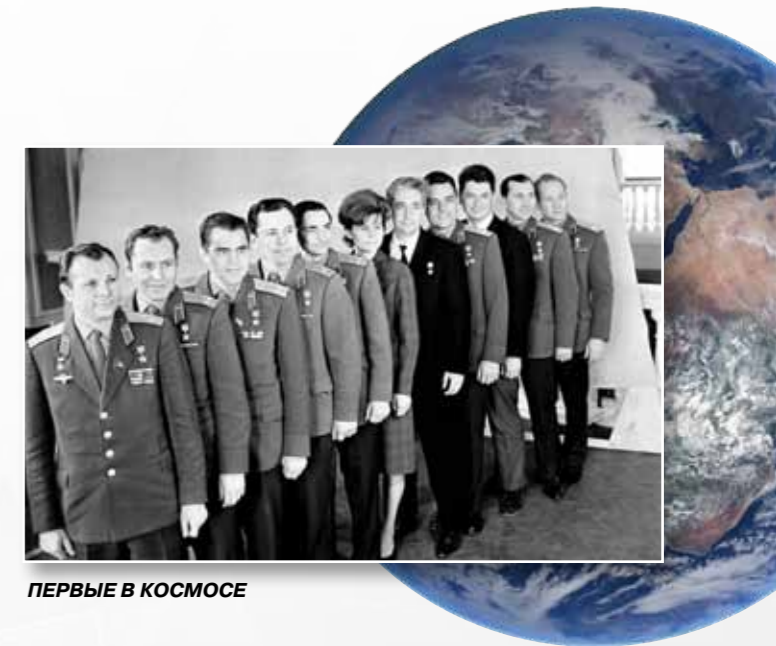
ПЕРВЫЕ В КОСМОСЕ

радиационный пояс Земли. Это был абсолютный мировой рекорд, до этого ни один пилотируемый космический летательный аппарат не достигал такой высоты. Несмотря на риск, выход в космос было решено не отменять. На первом витке вокруг Земли была надута шлюзовая камера «Волга» – началась подготовка к выходу в космическое пространство.