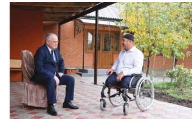
Внимание и поддержка каждому жителю республики

В Народном Собрании Республики Ингушетия седьмого созыва сложилась работоспособная и надежная команда, готовая работать в интересах жителей региона. Наши депутаты – разные по возрасту, роду занятий, убеждениям, взглядам, но все в одинаковой степени ответственны и неравнодушны к исполнению своих функциональных обязанностей, нуждам населения.