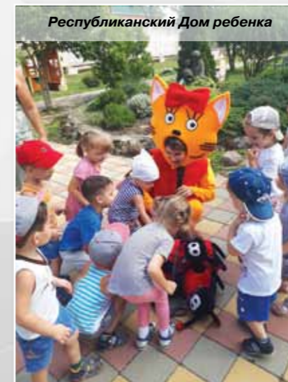
Республиканский Дом ребенка