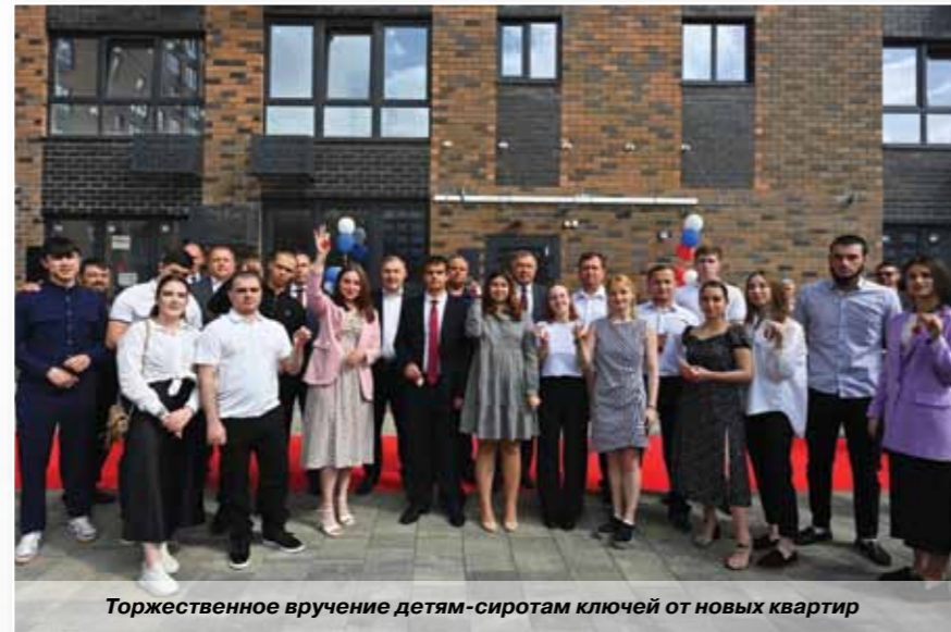
Торжественное вручение детям-сиротам ключей от новых квартир

На республиканском же уровне социальная защита данной категории детей регулируется региональными нормативно-правовыми актами, опирающимися и не противоречащими федеральному законодательству. Мы отработываем их совместно с Главой РА, сенаторами, депутатами Госдумы от Адыгеи, республиканскими профильными министерствами и комитетами. Так, в соответствии с Законом РА «О реализации дополнительных гарантий по социальной поддержке детей-сирот и детей, оставшихся без попечения родителей» детям-сиротам предоставляется: получение второго среднего профессионального образования без взимания платы; стипендии в полтора раза больше установленного размера для обучающихся; бесплатное