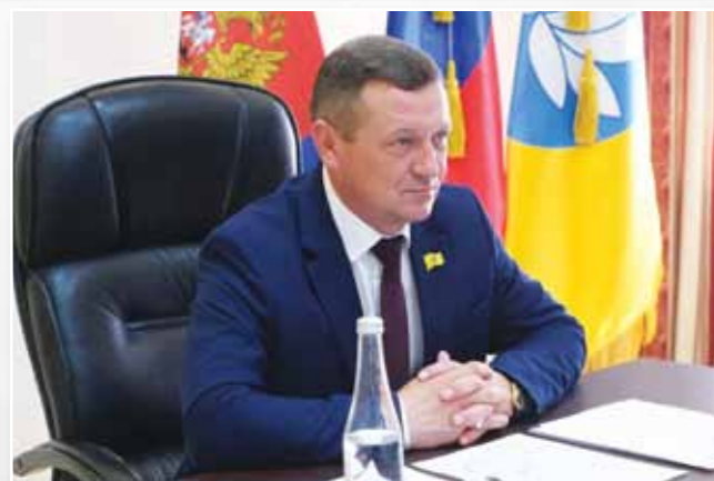
ПРЕДСЕДАТЕЛЬ НАРОДНОГО ХУРАЛА АРТЕМ МИХАЙЛОВ

В КАЛМЫКИИ НАРОДНЫЙ ХУРАЛ, ИЗБРАННЫЙ ПОЧТИ ГОД НАЗАД, АКТИВНО ТРУДИТСЯ НАД РЕШЕНИЕМ АКТУАЛЬНЫХ ЗАДАЧ, СТОЯЩИХ ПЕРЕД РЕГИОНОМ. В СОСТАВ ПАРЛАМЕНТА ВХОДЯТ ПРЕДСТАВИТЕЛИ ЧЕТЫРЕХ ПАРТИЙ, ВКЛЮЧАЯ НЕДАВНО ПОЯВИВШУЮСЯ НА ПОЛИТИЧЕСКОЙ АРЕНЕ ПАРТИЮ «НОВЫЕ ЛЮДИ». ЭТО МНОГООБРАЗИЕ ПОЛИТИЧЕСКИХ СИЛ ПРОДЕМОНСТРИРОВАЛО ГОТОВНОСТЬ К ДИАЛОГУ И СОВМЕСТНОЙ РАБОТЕ, ЧТО ПОЗВОЛЯЕТ ЭФФЕКТИВНО РЕШАТЬ ВАЖНЫЕ ВОПРОСЫ, КАСАЮЩИЕСЯ ЖИЗНИ ЛЮДЕЙ.