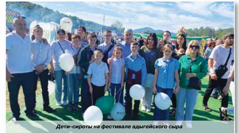
Дети-сироты на фестивале адыгейского сыра

В Адыгее по состоянию на 1 сентября 2024 года общее количество детей-сирот и детей оставшихся без попечения родителей составляет 1171, из них в организациях под надзором находится около 70 человек, остальные в приемных семьях, под патронажем родственников. Руководство региона и профильные службы нацелены на профилактику социального сиротства, на то, чтобы как можно больше таких ребятшек