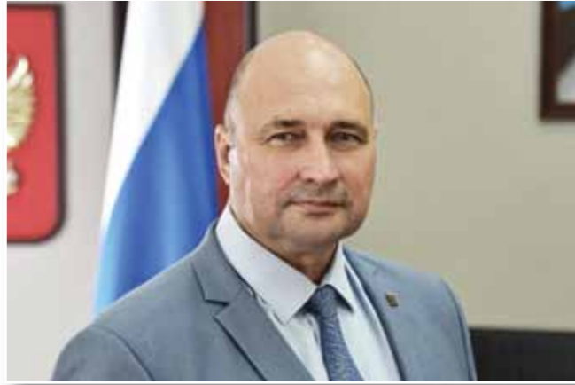
ВЛАДИМИР НЕМЦЕВ ПРЕДСЕДАТЕЛЬ ЗАКОНОДАТЕЛЬНОГО СОБРАНИЯ ГОРОДА СЕВАСТОПОЛЯ

В 2024 ГОДУ ЗАКОНОДАТЕЛЬНОЕ СОБРАНИЕ ГОРОДА СЕВАСТОПОЛЯ ОТМЕЧАЕТ 10-ЛЕТИЕ. 14 СЕНТЯБРЯ 2014 ГОДА, ВПЕРВЫЕ ПОСЛЕ ВОЗВРАЩЕНИЯ СЕВАСТОПОЛЯ В РОССИЙСКУЮ ФЕДЕРАЦИЮ ПРОШЛИ ВЫБОРЫ В ЗАКОНОДАТЕЛЬНОЕ СОБРАНИЕ ГОРОДА I СОЗЫВА. С ЭТОГО МОМЕНТА НАЧАЛСЯ НОВЫЙ ЭТАП РАБОТЫ СЕВАСТОПОЛЬСКОГО ПАРЛАМЕНТА. 22 СЕНТЯБРЯ 2014 ГОДА СОСТОЯЛОСЬ ПЕРВОЕ ПЛЕНАРНОЕ ЗАСЕДАНИЕ ПЕРВОЙ СЕССИИ ЗАКОНОДАТЕЛЬНОГО СОБРАНИЯ ГОРОДА СЕВАСТОПОЛЯ I СОЗЫВА. ДЕПУТАТЫ ПРИНЕСЛИ ПРИСЯГУ И ПРИСТУПИЛИ К РАБОТЕ.