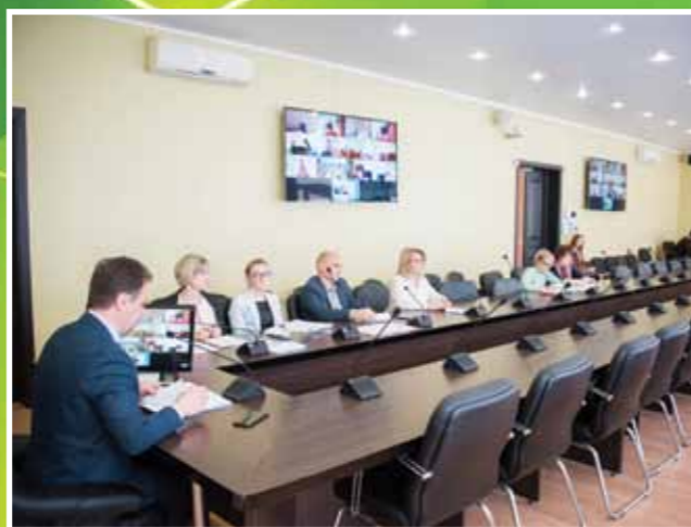
ДЕПУТАТЫ ДУМЫ ОБСУЖДАЮТ НА МЕЖМУНИЦИПАЛЬНЫХ СОВЕЩАНИЯХ ИЗМЕНЕНИЯ ЗАКОНОДАТЕЛЬСТВА

Речь идет о рекламе, которая транслируется с применением звукоусиливающего оборудования. «Инициатива подготовлена в связи с обращениями граждан. Они жалуются на некомфортные условия проживания в домах, где подобная реклама, хоть и не нарушает нормы СанПин, но транслируется из звуковых колонок непрерывно, зачастую ролики звучат в течение всего дня, и после окончания каждый из них начинается вновь. К злоупотреблениям со стороны рекламораспространителей приводит тот факт, что ограничение распространения звуковой рекламы в жилых домах на сегодняшний день в законодательстве отсутствует», – отметил Председатель Думы Астраханской области Игорь Мартынов.