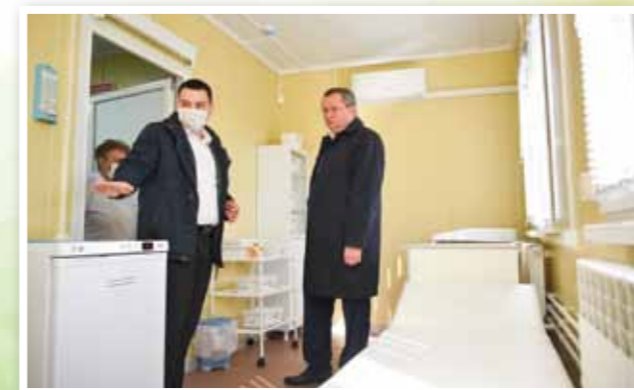
МОНИТОРИНГ РЕАЛИЗАЦИИ НАЦИОНАЛЬНЫХ ПРОЕКТОВ В РЕГИОНЕ

Спикер Думы Игорь Мартынов пояснил: «Поскольку в Думу Астраханской области поступают обращения граждан с просьбой отменить комиссии при оплате услуг ЖКХ, мы этот вопрос прорабатывали и обратили внимание, что, к примеру, оплата мобильной связи через онлайн-приложения банка происходит без комиссии. В то же время коммунальные услуги мы оплачиваем с комиссией хоть в приложении, хоть лично. А ведь эти платежи – неотъемлемая часть ежемесячных расходов граждан. Закон, которым предлагается ввести запрет на взимание комиссии с граждан при оплате жилого помещения и жилищно-коммунальных услуг принят в первом чтении еще 14 апреля 2020 года, но