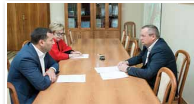
ВОПРОСЫ НАЛОГОВОГО ЗАКОНОДАТЕЛЬСТВА ПРОРАБАТЫВАЮТСЯ С ЭКСПЕРТАМИ