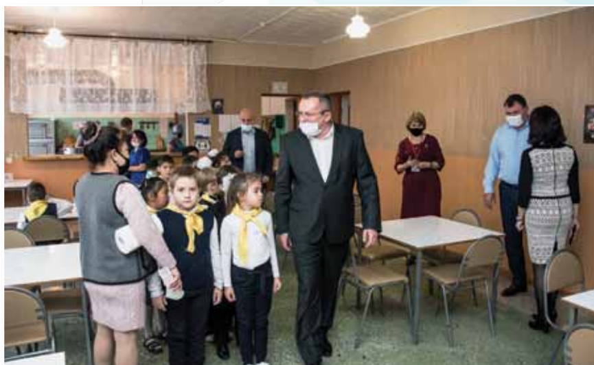
Школьное питание – на контроле родителей и депутатского корпуса.