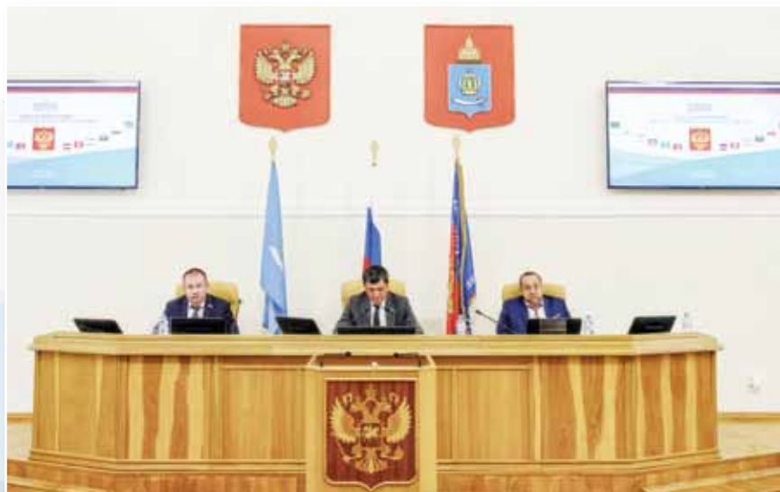
В следующем году ЮРПА отметит 20-летие. За годы работы рассмотрено более 800 инициатив

XXXIII Конференция ЮРПА в октябре также прошла в режиме телемоста. На обсуждение астраханские депутаты вынесли 8 вопросов. Формат видеоконференции не помешал построить конструктивный диалог, провести обмен мнениями и принять решения по каждому из внесенных вопросов.