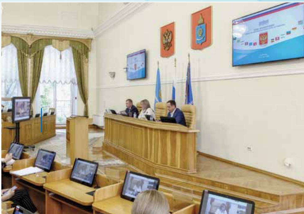
Предложения астраханских депутатов поддержаны ЮРПА

Все участники Конференции приняли активное участие в обсуждении актуальных вопросов. Думой Астраханской области в повестку дня было включено семь обращений и две законодательные инициативы. Все они по итогам общего голосования были поддержаны и направлены на федеральный уровень для рассмотрения.