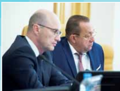
В приоритете – бюджет, парламентский контроль, стабилизация экономики

скверов, улиц защищены недостаточно. Существующие штрафы – а это 300-500 рублей – несоизмеримы с последствиями, наступающими при уничтожении зеленых насаждений, которых, например, в Астраханской области мало.