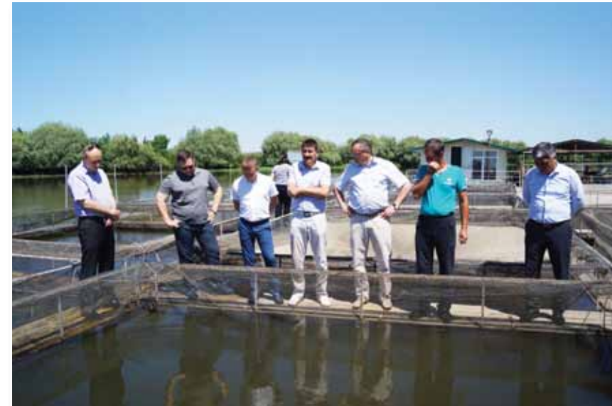
Посещение районов Астраханской области способствует эффективному распределению финансирования

Патентную систему налогообложения сейчас рассматривают как замену ЕНВД, который утратит силу с 1 января 2021 года. Стоит отметить, что суммы уплаченных доходов по ЕНВД и патенту полностью поступают в местные бюджеты. Это еще одна причина принять меры по повышению привлекательности патентной системы налогообложения.