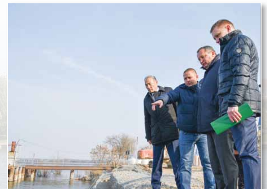
Контроль за ходом работ по объектам благоустройства

Также в поле зрения – защита прав несовершеннолетних, особенно тема продажи бестабачной никотиносодержащей продукции, которая запрещена региональным законом. Обязательно продолжится отслеживание практики применения закона, регулирующего отлов и содержание безнадзорных животных. Также на контроле проблема дольщиков, регулирование организации проведения капитального ремонта общего имущества в многоквартирных домах, отношений в области обращения с отходами, порядке управления и распоряжения государственной собственностью. Аграрный комитет займется вопросами правового регулирования охраны окружающей среды в части регулирования выбросов вредных (загрязняющих) веществ в атмосферный воздух в периоды неблагоприятных метеорологических условий. Финансовый комитет рассмотрит практику реализации закона, регулирующего осуществление инвестиционной политики на территории Астраханской области.