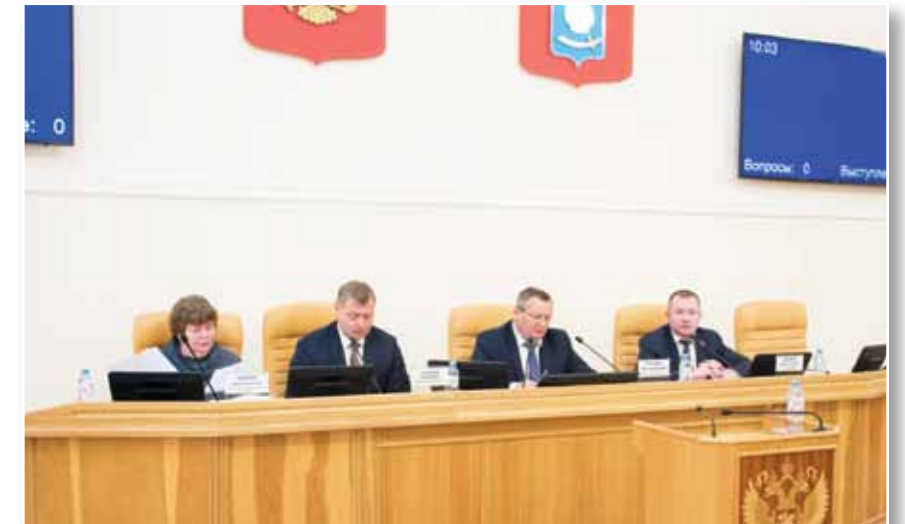
Законодатели Астраханской области работают в диалоге с Губернатором и Правительством Астраханской области