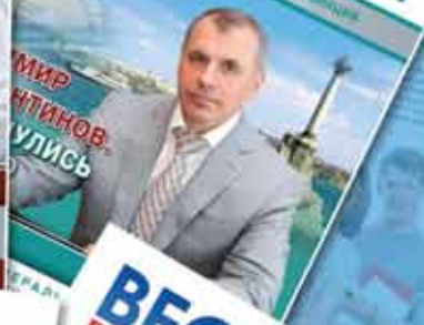
МИР АНТИНОВ УЛИСЬ