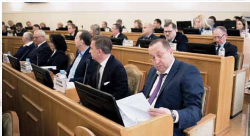
Меры поддержки бизнеса и граждан в сложный период – основные вопросы повестки дня заседаний