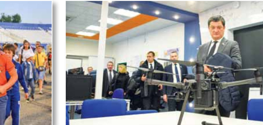
Высокие технологии в сфере образования – нужный опыт

Уделяется большое внимание совершенствованию налогового законодательства. Так, депутаты поддержали проект закона, которым