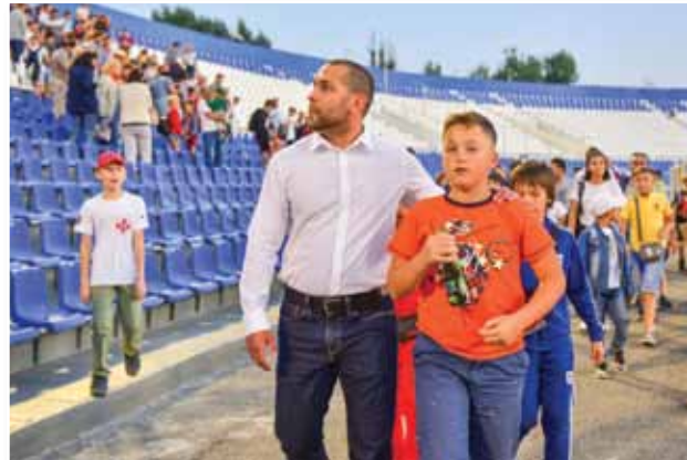
Депутаты помогают детям приобщаться к спорту

вый размер теперь составляет 500 рублей. Для отдельных категорий оно составляет 1000 рублей. Выросло ежемесячное пособие на оплату жилого помещения и коммунальных услуг, на оплату проезда, на приобретение школьной формы. Теперь многодетным семьям станет легче подтвердить свой статус. Из положений закона исключено требование о совместном проживании граждан, воспитывающих трех и более детей.