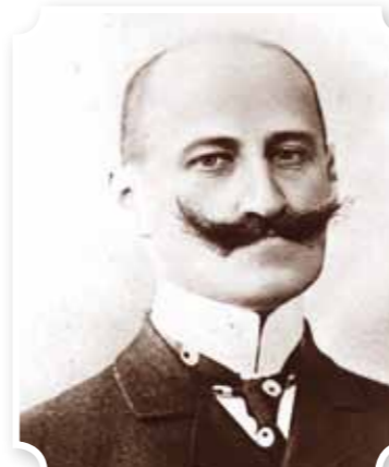
ФЁДОР АЛЕКСАНДРОВИЧ ГОЛОВИН – председатель Государственной думы Российской империи II созыва, земский деятель, один из основателей партии кадетов и член её ЦК. В должности – с 20 февраля по 3 (16) июня 1907 года.

Вторая Государственная дума работала с 20 февраля по 3 июня 1907 года. Её председателем был избран Фёдор Алексеевич Головин, также представлявший Конституционно-демократическую партию.