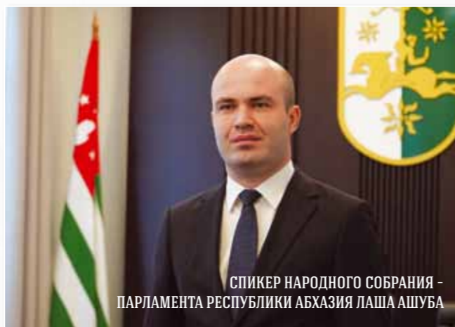
СПИКЕР НАРОДНОГО СОБРАНИЯ - ПАРЛАМЕНТА РЕСПУБЛИКИ АБХАЗИЯ ЛАША АШУБА

Через институт ЮРПА наш Парламент получил возможность выходить на различные политические трибуны Российской Федерации с обращениями о признании независимости нашего государства. Это стало важным направлением к юридическому международному признанию. В 2006 году мы получили поддержку Обращения