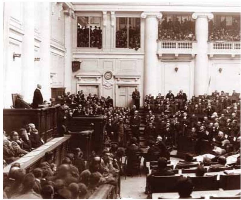
Государственная дума Российской империи IV созыва

Четвёртая Государственная дума (1912–1917) стала последней в истории императорской России. Она работала в условиях нарастающего политического кризиса и завершила своё существование после Февральской революции 1917 года. 6 октября 1917 года была подведена черта под недолгой историей Государственной думы России начала XX века. Несмотря на короткую историю, главный итог этого периода заключался в том, что Государственная дума стала неотъемлемой частью политической жизни России.